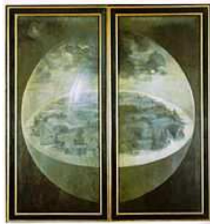
Le Jardin des délices, volets fermés